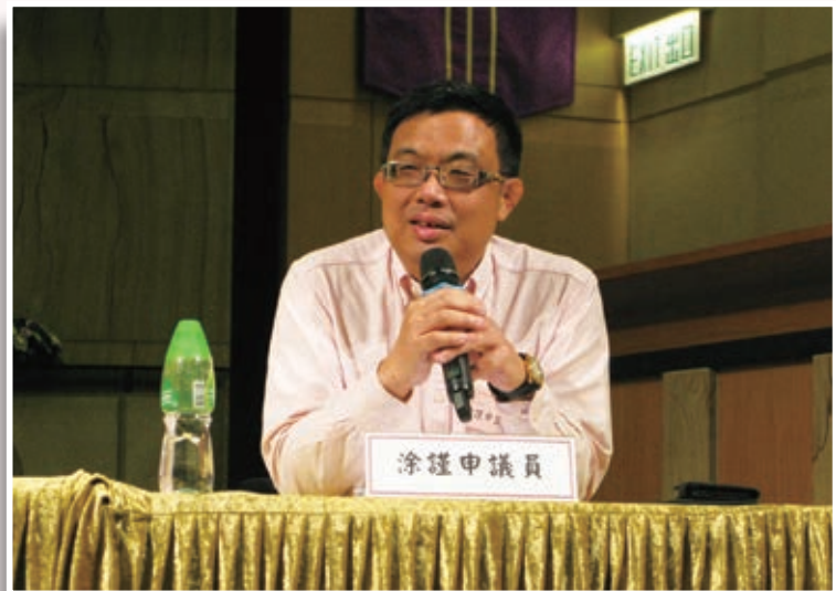
第一位講者為立法會議員涂謹申先生