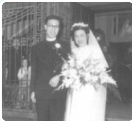
一九五一年在香港堂舉行婚禮

雖然黃師母並非本會教友，令她有時候不能參與教會的事奉工作，但「師母」的身分也為黃師母帶來很多不同機構邀請參與事奉的機會，可是她對大部分邀請都拒絕了。即使參與了這些機構事奉，黃師母也堅持不當「主席」，只作委員。