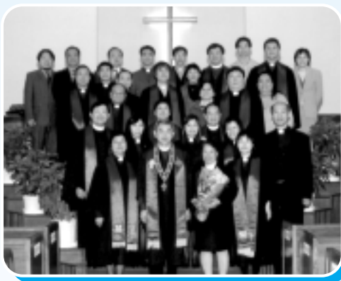
伍會吏（持花者）與本會會長及教牧同工於其按立典禮上合照

帝就是這樣奇妙地帶領我，第一個踏足的工場竟是循道衛理會北角堂，上帝就這樣領我在北角堂默默服侍了廿多年，在這漫長的歲月裏，只感到時間的飛逝和上帝無盡的恩典。