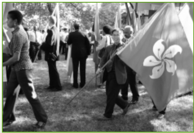
25週年活動進場儀式

在敬拜聚會之中，各人的即場回應，甚至有非洲的姊妹自由地跟隨詩歌起舞，我起初並不太習慣，但最後也正如坐我旁邊的德國牧師所言：我很想念她們的跳舞！是的，非洲弟兄姊妹在文化晚會，不用樂器，以男女對唱的形式唱出他們的詩歌，也只是兩句歌詞「What kind of Church is it? It is a Holy Spirit (Ghost) Church」，已經使全場和應。當然，還有巴西的代表，他們在台前讀出耶穌在井旁談道的故事，而台後就用不同的色彩，來