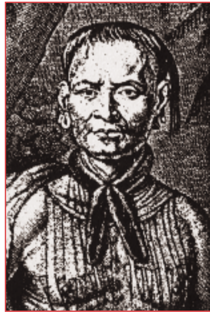
印第安酋長湯莫沙契

這位年輕的宣教士確是心裏火熱，幹勁十足，每天的工作都安排得滿滿的。他曾寫下：「基本上我每天五時起牀，有時是四時。我常參加德國人（莫拉維亞弟兄會）的早禱，然後獨自前往法院（當時權充作禮拜堂用途，今天這建築物仍在），宣讀《安立甘宗早禱日課》（Anglican Office Of Morning Prayer），然後常作散步，並同時與一兩個人談論宗教。我通常與德國人一同吃早餐，作進一步的教牧交談，或是閱讀。然後會去德