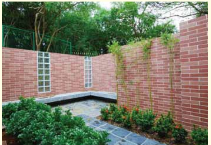
▲ 後園遍植花草，亦是默想靈修好地方。