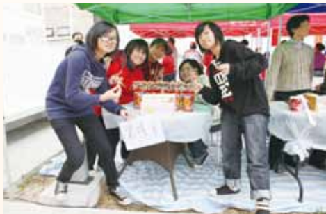
衛理園開放日各式美食攤位