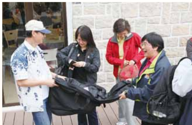
▲ 弟兄姊妹慷慨解囊，支持衛理園重修。