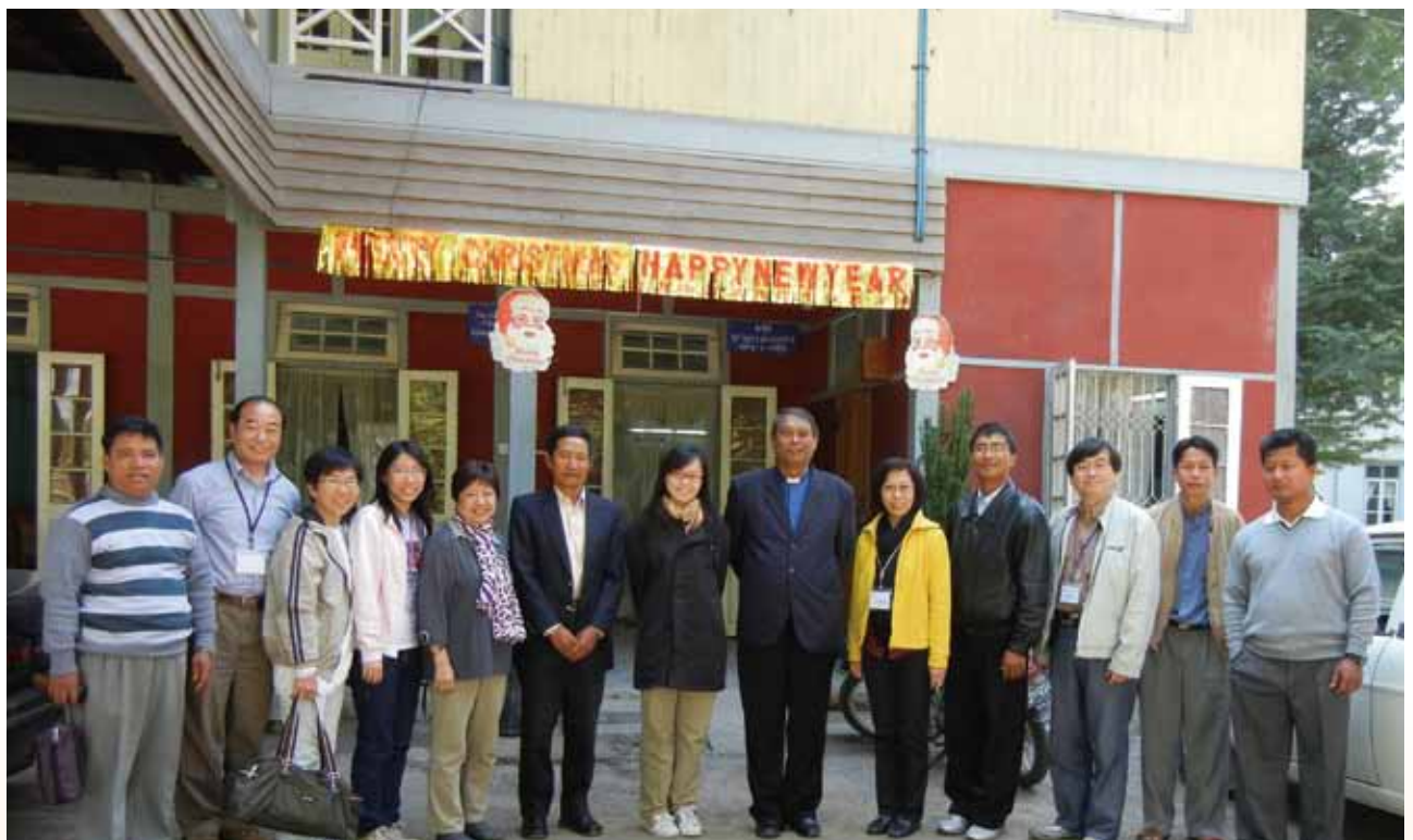
▲ 探訪曼德里循道衛理會總議會辦事處