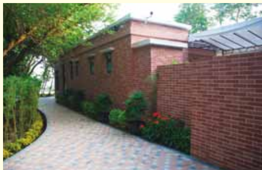
▲ 沿小徑進入屋子，一旁的綠蔭先讓心境平靜下來。