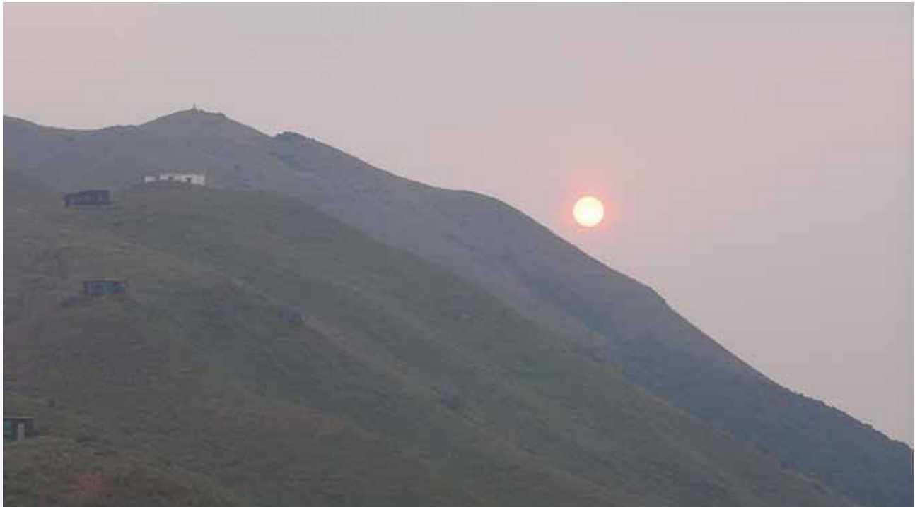
▲ 大東山的日落美景

觀看錄影片段請登入： http://www.methodist.org.hk/publications/monthlynews/