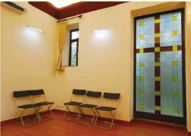
▲ 大廳將擺設本會文物