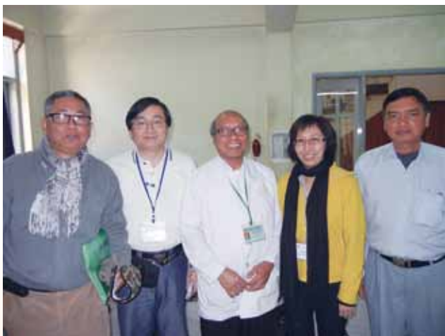
▲ 與Tahan Wesley Hospiatal院長合照