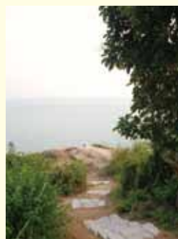
▲ 前院有小路通向海邊