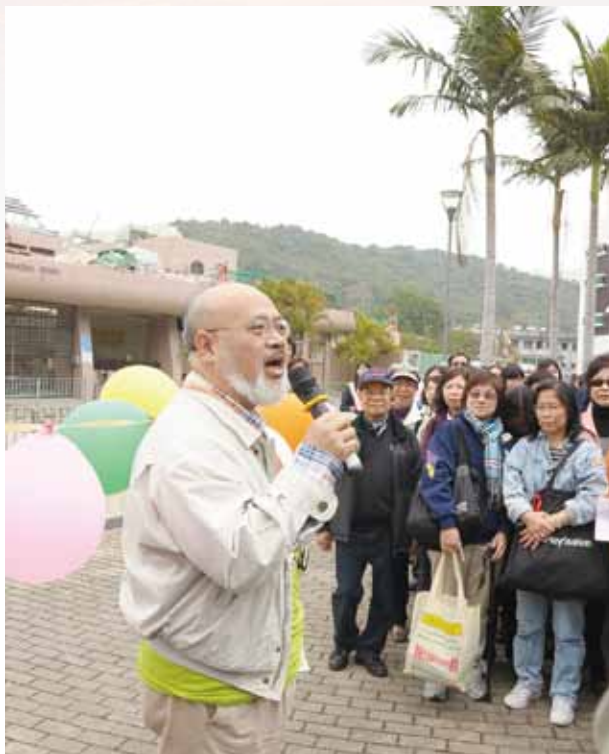
▲ 盧牧師主持「衛理園步行籌款」於梅窩的起步禮

(Wesley Lodge)；另一個是鮮為人知、較少人到訪的大嶼山大東山8號營舍，是循道公會的英國差遣員於一九三〇年代興建的。衛理公會在長洲山頂道7號原有一個退修場地，但因維修困難，屋宇情況變壞，以致少人使用，後來賣給隔鄰救世軍，使他們可以擴大大空間提供服務，而我們使用出售的款項購買了位於衛理園內的衛理山莊；另一個就是我們剛完成重修的衛理園。