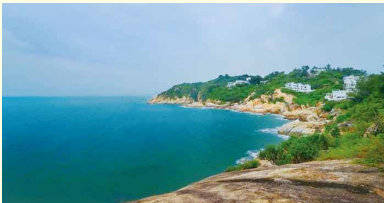
▲ 小屋臨海，壯麗的海景盡洗煩憂。