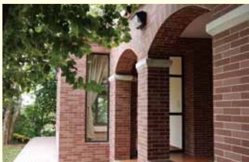
▲ 重修後保留屋前的拱型門廊，為1920年代的建築特色。