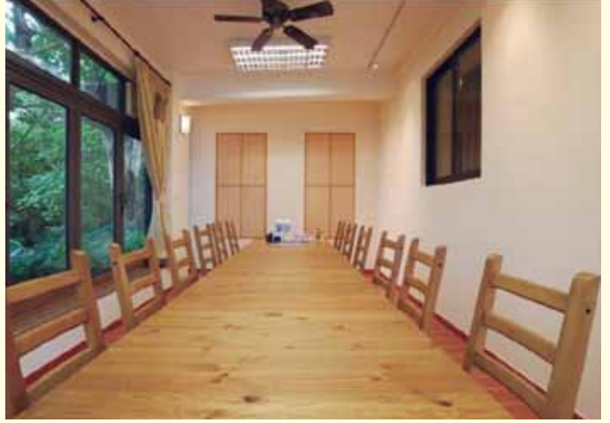
▲ 小屋設有寬敞活動室，可進行各式活動。