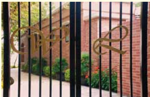
▲ 小屋鐵閘上「W」「L」為Wesley Lodge的簡稱

衛 斯理小屋位於長洲山頂道24號，鄰近建道神學院，由碼頭步行十多分鐘便可抵達。小屋提供八個宿位及少量臨時宿位，以自助形式租用，附設花園，三面環海，空間廣闊，景色怡人，是本港少見的天然環境，適合小組或家庭作退修或休憩之用。