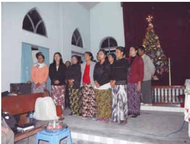
▲ 參加Tahan 教區Myohla教會崇拜