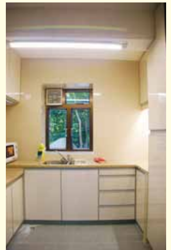
▲ 小屋共有三間睡房、三個獨立浴室，舒適雅潔；廚房設備齊全。