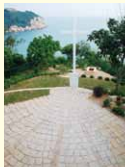
▲ 前院鋪設成貝殼形狀