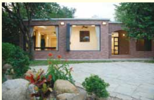
▲ 小屋設計寧靜開揚