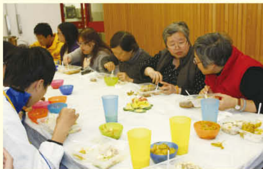
亞斯理社會服務處之同工協助製作「啟發」愛筵