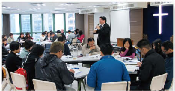
Training The Trainers 進階訓練

Training The Trainers ：為幫助宣教同工能持續在各堂開辦「信仰分享大使訓練班」以更切合堂本的需要和發展，今年特於三月廿九日（禮拜二）上午九時至下午五時在香港堂舉辦Training The Trainers進階訓練，透過濃縮地演習訓練「信仰分享大使」五次課堂之內容，幫助全體宣教同工更掌握本運動之精髓，訓練的重點，俾彼等日後均能在各該堂所內訓練會眾成為「信仰分享大使」及推展本運動。