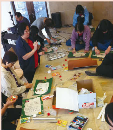
一同製作自己的墓誌銘

生命由天父所賜 生命如歌 願大家能享受神為每人創作的獨特樂章 愛己、愛人 活出神所喜悅的樣式 🌈