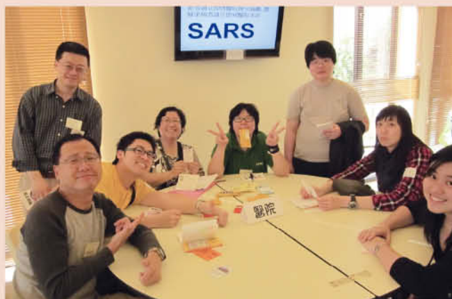
在遊戲「生命之旅」中遇上「SARS」齊齊在醫院區域中等候康復