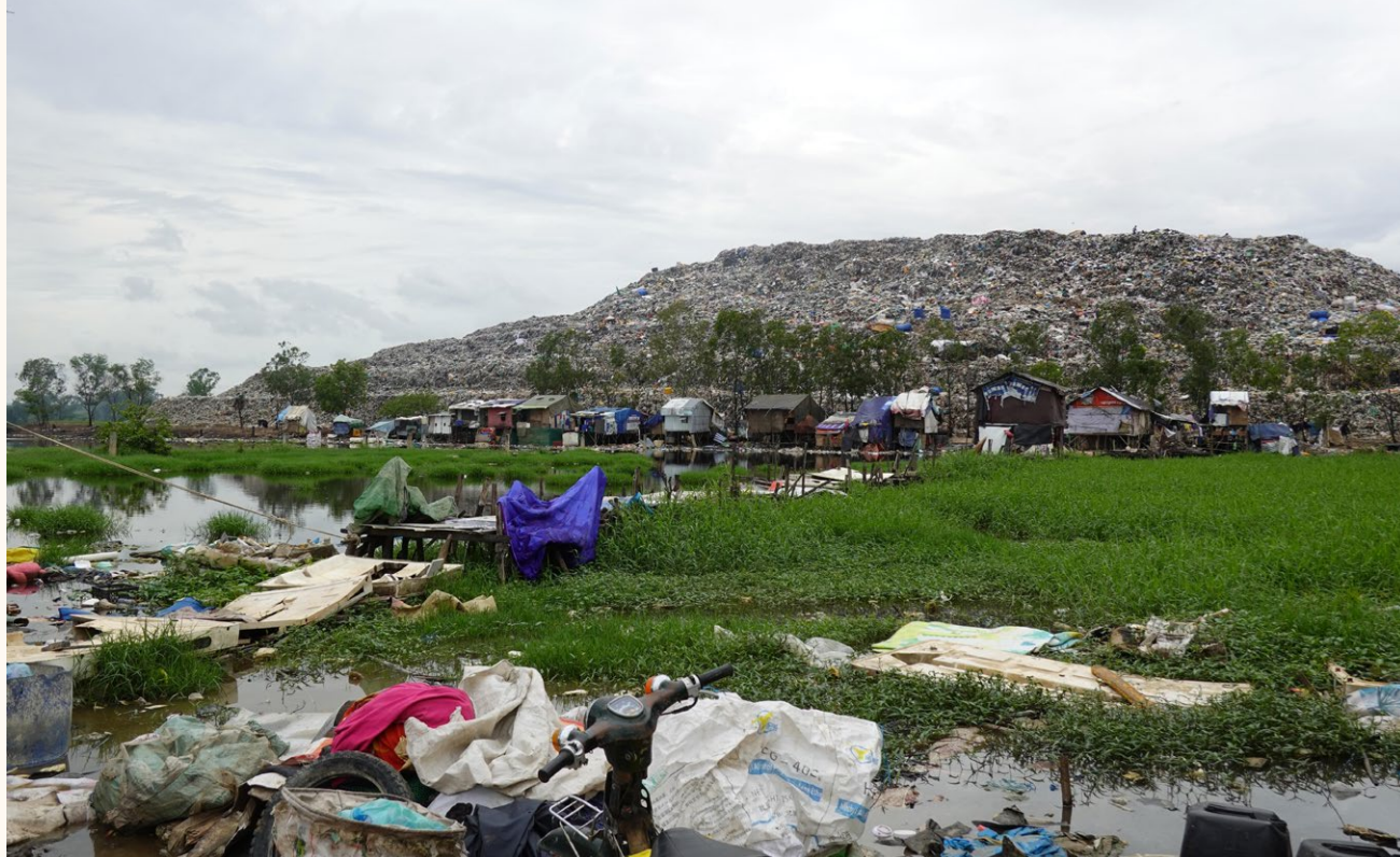
探訪垃圾山棚屋居民