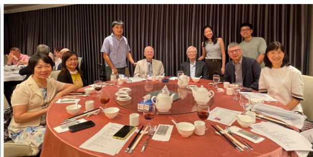
李牧師與在港家人：弟弟（右五）及其兒孫；以及照顧者（左邊三位）合照。