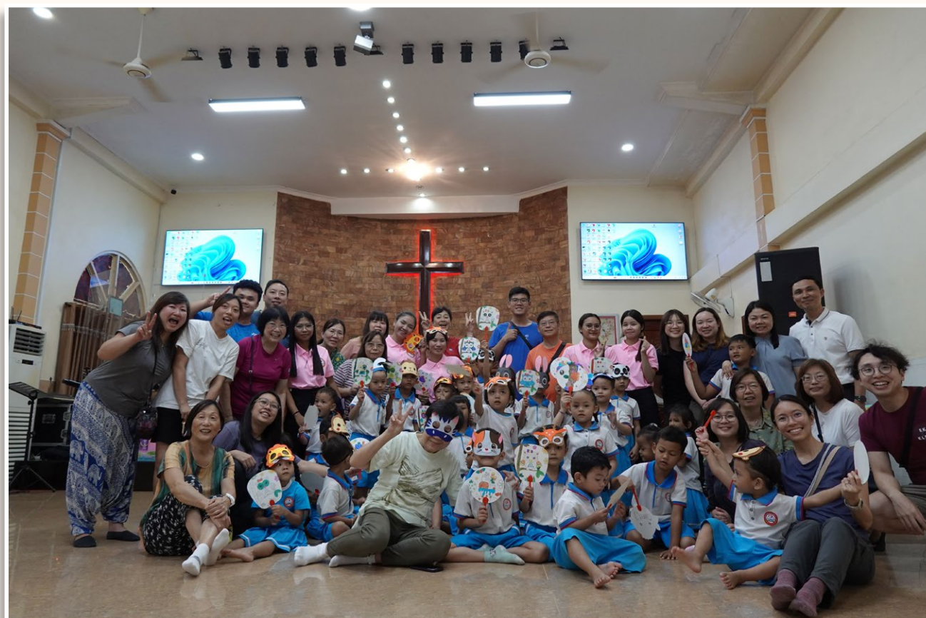
馬德望省幼稚園活動