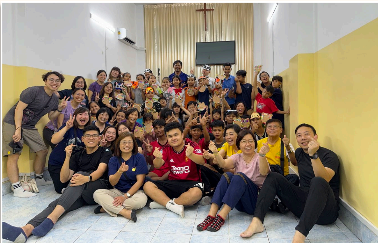
金邊榮耀堂英文班服侍