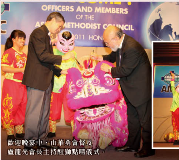
歡迎晚宴中，由華勇會督及盧龍光會長主持醒獅點睛儀式。