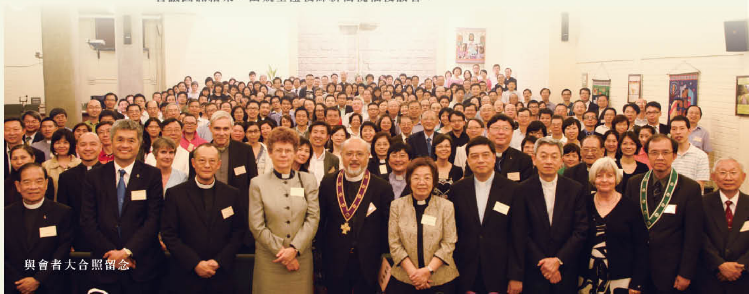
與會者大合照留念