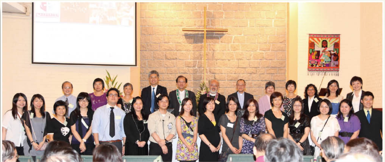
總議會辦事處同工與現任會長、副會長、總議會書記及司庫合照。

同意在基層社區建立之堂所若主動發展事工，而起步需要財政上之支援，總議會應考慮傾斜支持。基於是項原則，接納愛華村堂之申請，傾斜支援該堂發展「基層宣教事工」計劃，未來三年由「教會發展專款」撥款資助該堂聘請一名堂區宣教師，聯同會友，支援及牧養由福利部社工及宣教幹事接觸之區內基層家庭，以四十八萬元為上限。