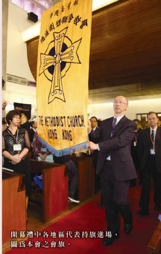
開幕禮中各地區代表持旗進場，圖為本會之會旗。

翌日各地代表分別到本港不同堂所參加主日崇拜，並安排負責講道，崇拜後並有機會與各堂牧者及堂區領袖午膳團契，樂也融融。下午及晚上繼續會議，並選出大會二〇一一至二〇一四年度之會長及書記。廿七日完成上午會議後，下午為遊覽時間，大會安排了三個本地行程供參加者揀選，認識本會及香港不同面貌；最後一天為閉幕禮。四天行程很快過去，各代表均說此行收穫甚豐，並感受到弟兄姊妹的情誼，對香港印象尤為深刻。