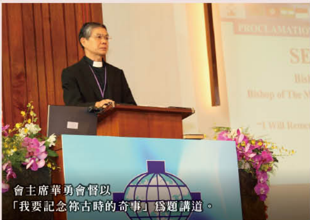
會主席華勇會督以「我要記念祢古時的奇事」為題講道。