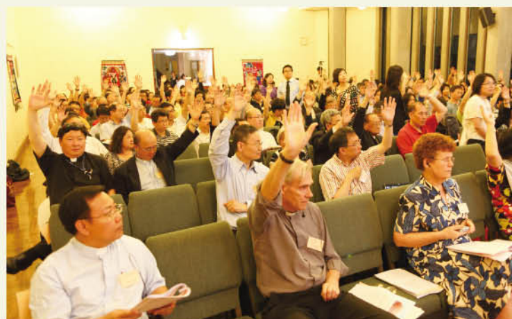
與會者踴躍舉手表示同意有關提案。