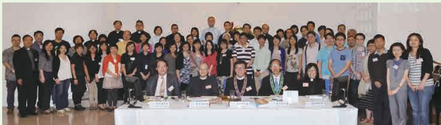
與本會之宣教同工合照。