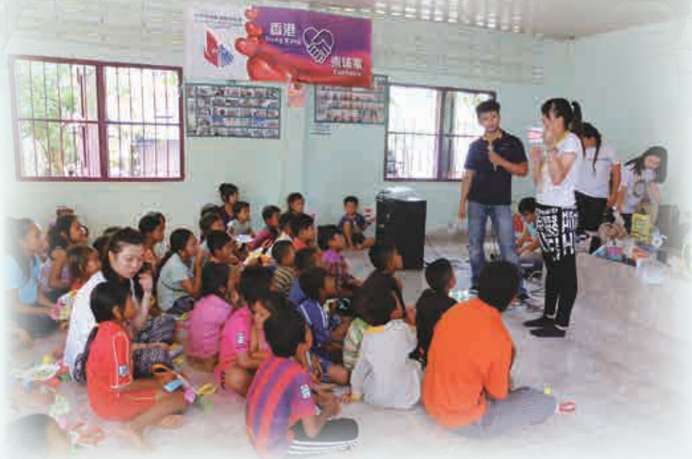
小朋友專心聆聽牙齒護理講座，之後還獲牙刷和牙膏回家使用。

八月四日，我們一行二十一人浩浩蕩蕩地從香港機場出發。到步後大家稍作休息，享用過第一頓柬埔寨晚餐後，我們便分工合作，迅速包好五十個禮物包，包括罐頭、麵包、即食麵和清水等，準備送到一班露宿者手上。我們先到了一棟廢棄大廈的旁邊一個約有半米上蓋的地方，那裏已聚集了一大群露宿者。之後再到火車站前，甫到達便看見幾個帳幕，其中一個住了一家四口，我們送上食物和水後，他們立即進食。探訪完畢後，我們便坐了柬埔寨的特色篤篤車（機動人力車）回酒店結束首天行程。