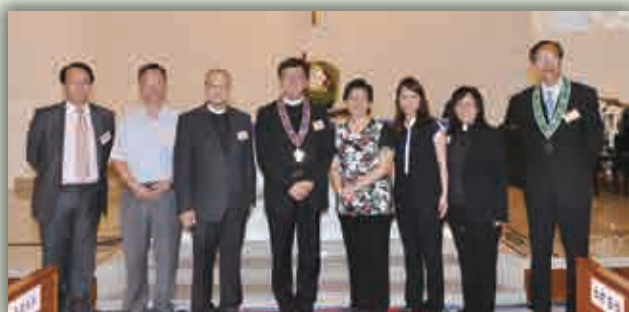
現任會長（左四）、卸任會長（左三），副會長（右一）、司庫（左一）及書記（右二）與三位社會服務機構總幹事及署理總幹事合照。

澳門事工委員會之建議，聘請院牧以牧養日益增多之同工、院友及彼等之家人，有關支出由澳門社會服務處及澳門宣教事工分擔。