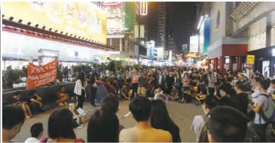
去年10月18日晚上的旺角，多處地方進行類似公共討論。

其實，佔領不單是一場運動，其連續性更具備一種社羣生活。公民羣體在當中逐漸孕育各種民主政治生活所需的德性，諸如忍耐、勇氣、謙柔、說真話、盼望。面對六一八政改表決後的香港社會，我們需要走出「抽水」式自我良好氛圍，思考下一步如何爭取真普選。戴耀廷教授於本年三月六日提出的「公民社會選特首」方案 7 值得社會仔細留意及討論（因本文主題所限，在此不作討論）。盼後雨傘的香港公民社會（包括本人在內）繼續學習與張力及衝突共處、不懈地與各區各處市民對話，並鼓勵他們參與未來一個個公投及公民運動。