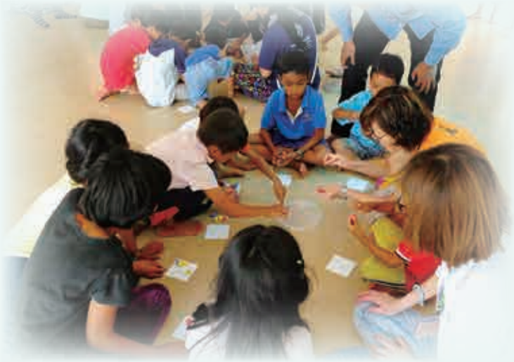
雖然手工很簡單，但小朋友非常投入和享受。