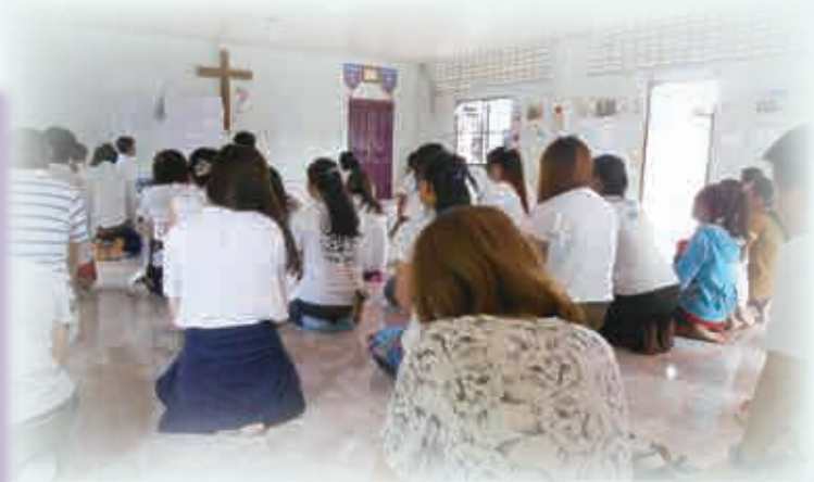
縱然團友不明白柬文詩歌的內容，但卻讓我們深深感受只要彼此同心敬拜，上帝便在其中。

跨 出香港這個安舒圈，看到最需要幫助的一群——柬埔寨的無家者、智障兒童，令我反思原來人的尊嚴是可以被剝奪得絲毫不剩，原來尊嚴在現世代與金錢是如此密不可分。感謝上主給我這個珍貴的機會去接觸一個與香港有如斯大差別的地方，成為我成長的轉捩點，更懂感恩！