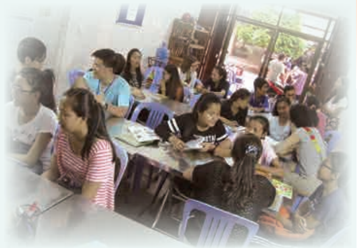
英文班學員積極學習的態度，讓團友們也很快投入起來。