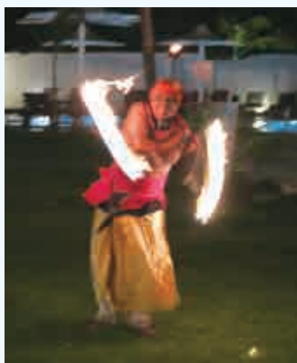
斯里蘭卡民族舞蹈