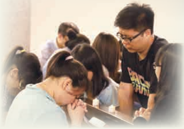
參加者為中國祈禱