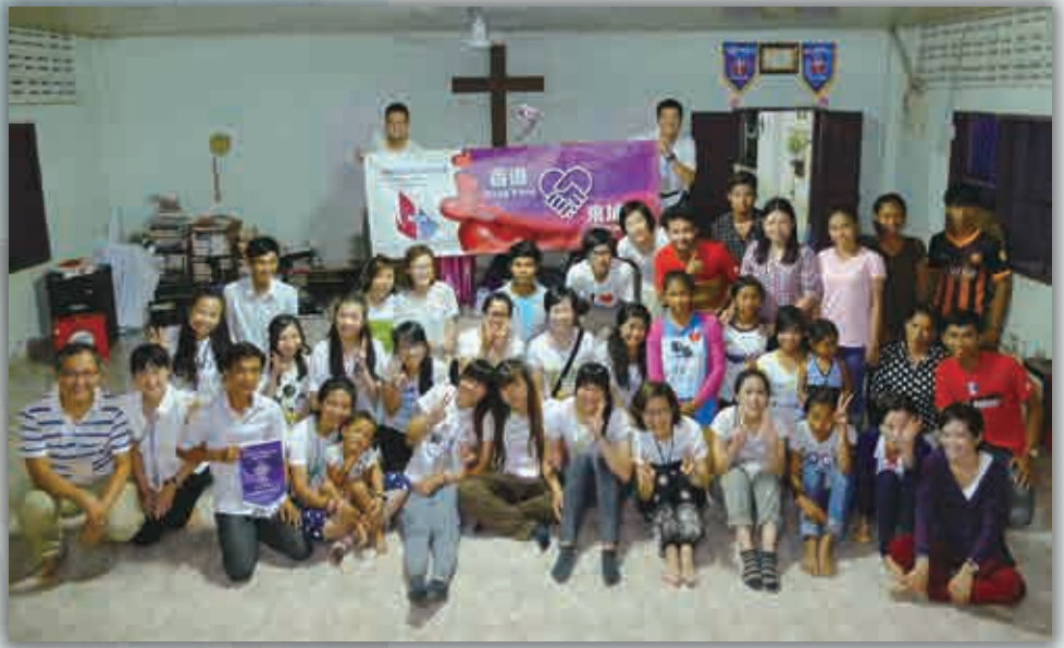
經過兩日醫療服侍，本會團友和當地弟兄姊妹仍很興奮及彼此交流分享。