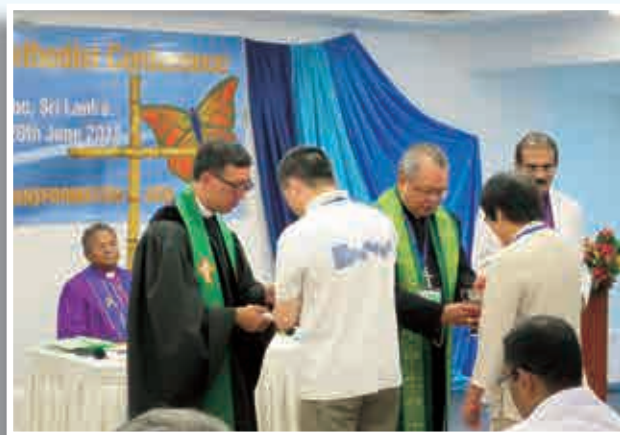
林牧師與Sagar會督主禮施餐