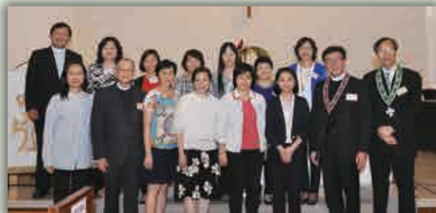
分別與本會屬下中學（上）、小學（中）及幼稚園幼兒園（下）之校長合照。