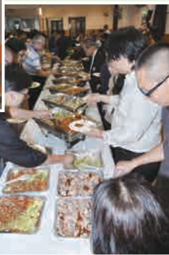
翌日會議之晚膳以自助餐形式進行，與會者一起分享友誼團契。

接納義務教士委員會之建議，定期舉行「義務教士成長小組」，以推動本會義務教士有系統地持續學習及彼此支援。