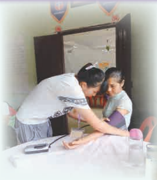
醫護團隊專業而認真的態度，獲當地衛生官員讚賞。