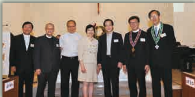
現任會長（右二）、卸任會長（左二），副會長（右一）及學校教育部部長（左一）與三位於本年度離任及榮休之屬校校長合照，感謝俾等於本會多年之事奉。