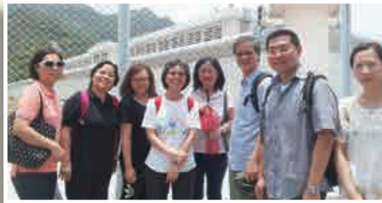
其中八位訓練班參加者參與實習， 探訪羅湖懲教所

我們只是微小的管子，上帝藉着我們工作，讓我們帶着愛，相信世界需要愛，並相信愛能改變生活。我們微小的付出，當被上帝使用時，就帶來很大的改變和祝福。