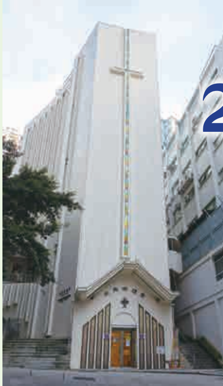
是次代表部會議在本會北角衛理堂舉行，出席、列席及旁聽者近四百二十人。