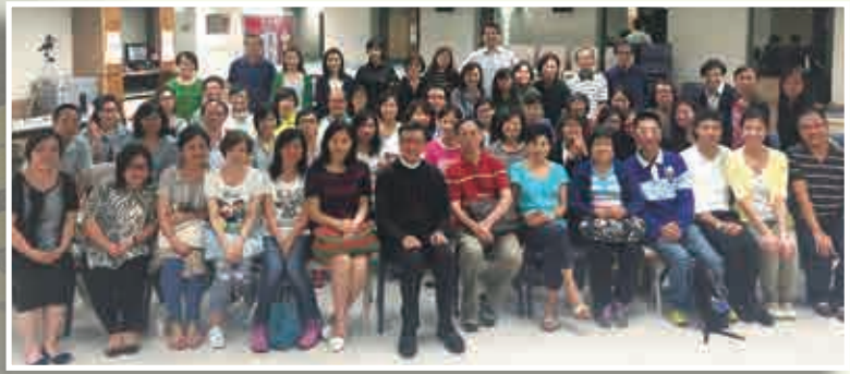
會長於結業禮與全體參加者拍照留念