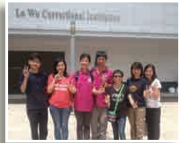
參加者探訪沙咀懲教所