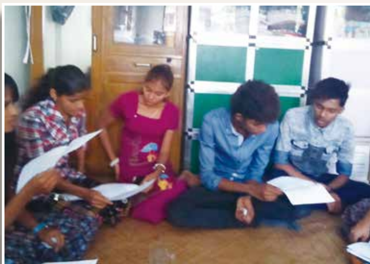
年輕人（公義）立約小組探訪病患