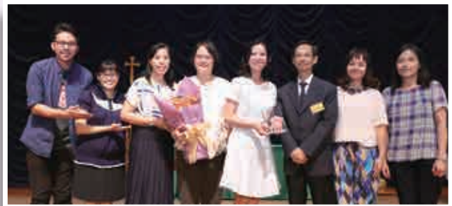
丹拿山循道學校（「藝」造社群）