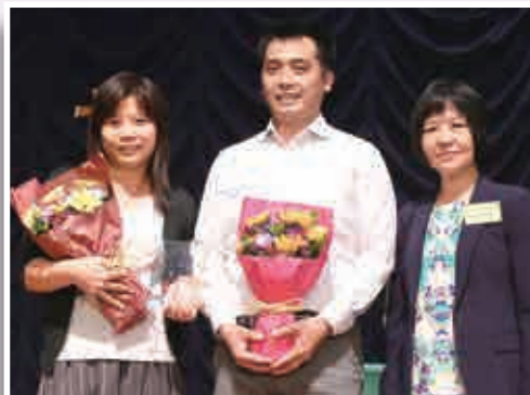
炮台山循道衛理中學（港澳獨木舟遠征2016）