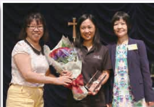
天水圍循道衛理中學（港澳獨木舟遠征2016及沙畫藝術繪出身、心、靈的空間）