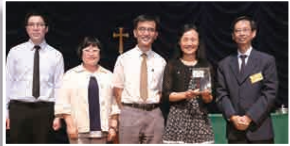
循道中學（製作校園電視台節目：R.H.S.）