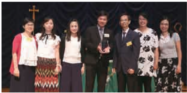
馬鞍山循道衛理小學（馬循默想小徑計劃）