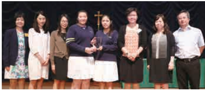
葵涌循道中學（輔導委員會——飛躍學堂）