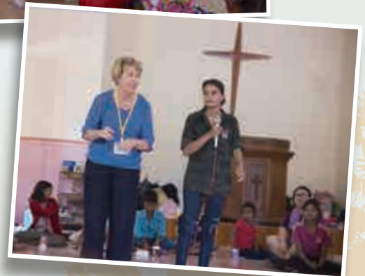
「英文夏令營」學習篇